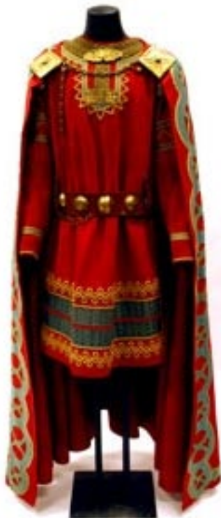
En av operans Arnljot-kostymer!